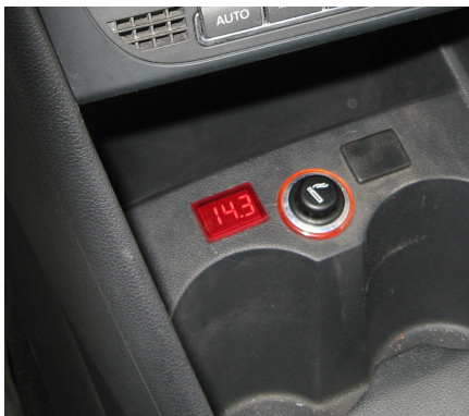
Рисунок 1. Цифровой индикатор напряжения бортовой сети.

Индикатор напряжения представляет собой микропроцессорное устройство, которое подключается к бортовой питающей сети автомобиля. Микроконтроллер измеряет напряжение в этой сети и отображает значение на цифровом индикаторе.