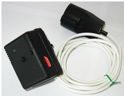
Рисунок 1. GSM розетка. Внешний вид.

Кнопка используется для ручного управления нагрузкой. Кратковременное нажатие кнопки включает или выключает нагрузку.