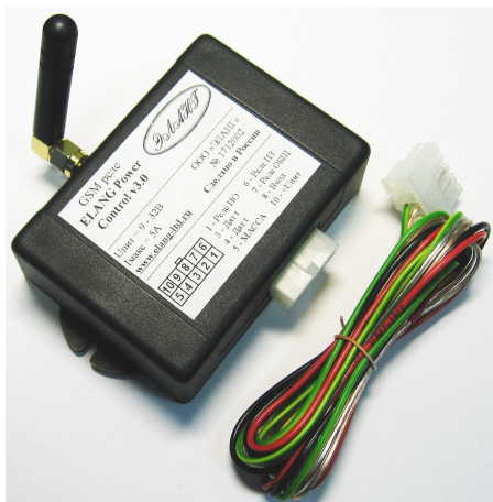
Рисунок 1. GSM реле. Внешний вид.

Светодиоды предназначены для индикации режимов работы устройства. Красный светодиод показывает состояние реле, управляющего нагрузкой: горит — включено, погашен — выключено. Зеленый светодиод сигнализирует о состоянии GSM сети. Короткие вспышки каждые три секунды — есть регистрация в сети.